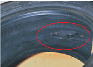
Fig(1): Desprendimiento interno por rodar a baja presión.

Se presentan evidencias de grietas y rajaduras cercanas al área del talón, deformaciones de la pestaña y desprendimientos del liner y/o lona de la parte interna de la llanta como consecuencia de haber rodado a baja presión y/o sobrecarga.