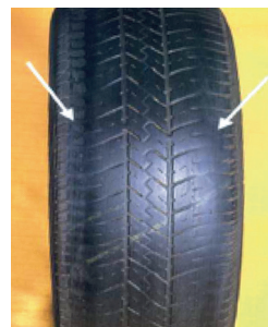
Fig (6A): Reparaciones en caliente hechas por terceros, en forma irregular.