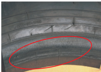
Fig(2): Grietas en la región del costado por rodar en sobrecarga.