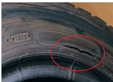
Fig(3): Corte circunferencial región del costado por rodar en sobrecarga.