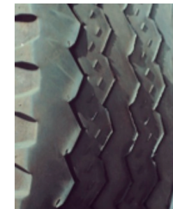
Fig (6B) El desgaste irregular y excesivo que supere el 50%.