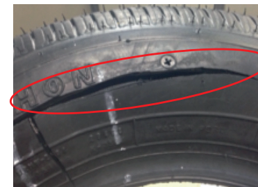
Fig(7): Cortes producidos con objetos punzantes.

Cortes en forma uniforme. Al inspeccionar la llanta, la superficie del corte se muestra de forma uniforme y no se aprecian huellas o indicios de impactos.